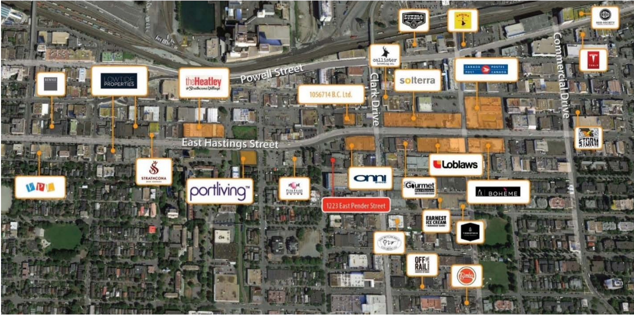
Corridor de Hastings Street – figure 2

Représentation conceptuelle montrant l'aménagement potentiel de Hastings Street entre Hawks Avenue et Clark Drive.